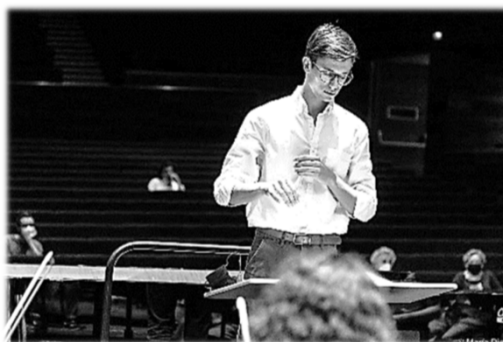
Asistente de dirección de la OFS