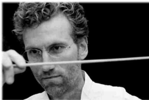
Director Titular de la OFS